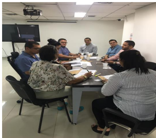
Los integrantes de la CRM Bolívar en una de sus reuniones ordinarias mes de agosto, priorizando en esta ocasión el seguimiento a programas de alimentación escolar.

Como resultado de la reunión, los miembros que conforman la Comisión acordaron dar celeridad a estas acciones y poner en diálogo los hallazgos generados entre las entidades, a fin de subsanar la afectación ocasionada a los recursos públicos del departamento y a la calidad de vida de la población.